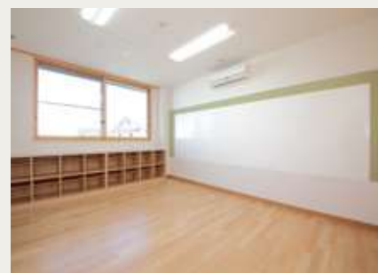
児童クラブ・学習室