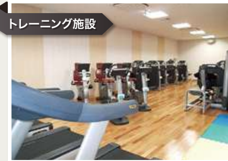
トレーニング施設

公益財団法人岩手県予防医学協会「Big Waffle(ビッグワッフル)」は昨年、時代に即応した新たな取り組みを行うために移転し、健康施設としてのスタンダードをめざしオープンいたしました。明るく開放的な施設は、健康診断や人間ドックなどを受診いただけるほか、健康げんき倶楽部「気楽良」や、気軽にご利用いただけるヘルシーレストラン「食楽良」も併設しております。