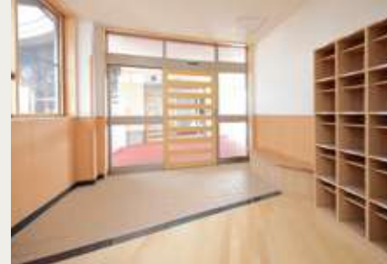
デイサービス・児童クラブ玄関