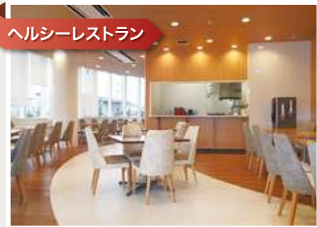
ヘルシーレストラン