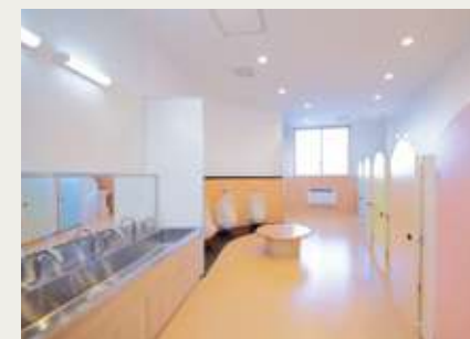
子どもたちのトイレ