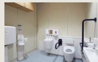
ユニバーサルデザインの「だれでもトイレ」