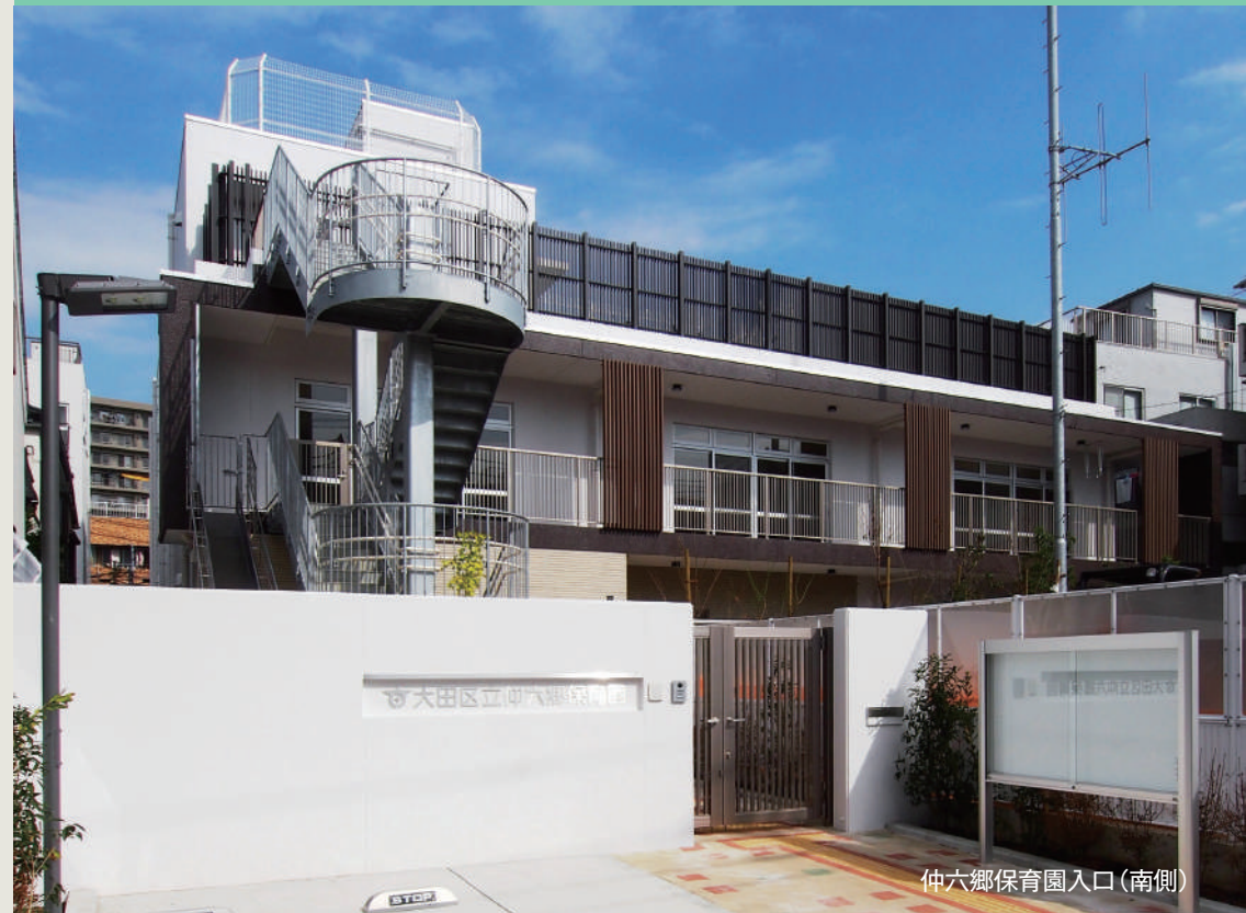
仲六郷保育園入口(南側)