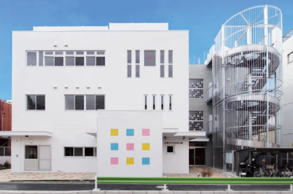
子育てひろば仲六郷入口（北側）