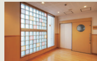
ガラスブロックが明るさを運ぶEVホール