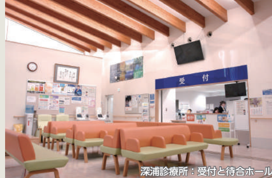
深浦診療所：受付と待合ホール