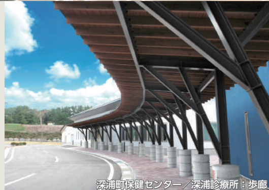
深浦町保健センター／深浦診療所：歩廊