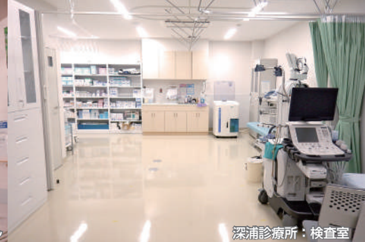
深浦診療所：検査室