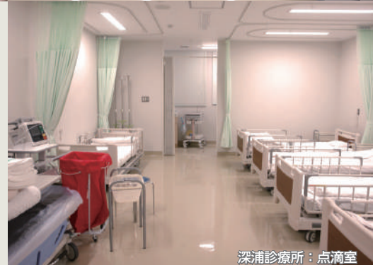
深浦診療所：点滴室