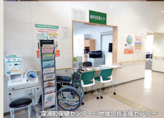
深浦町保健センター：地域包括支援センター