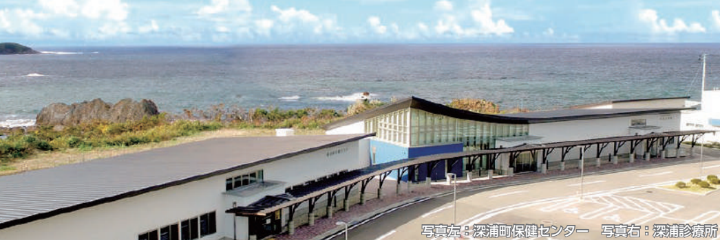
写真左：深浦町保健センター 写真右：深浦診療所