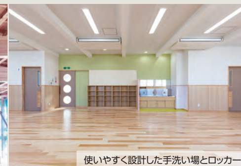
使いやすく設計した手洗い場とロッカー