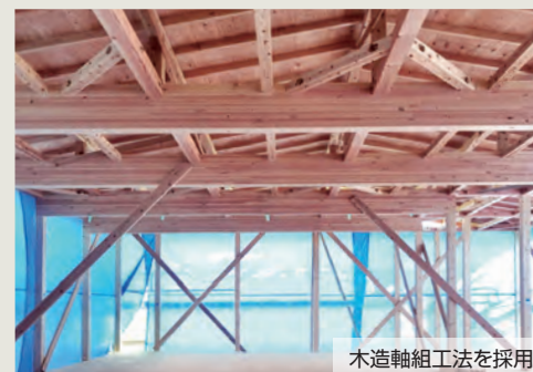
木造軸組工法を採用