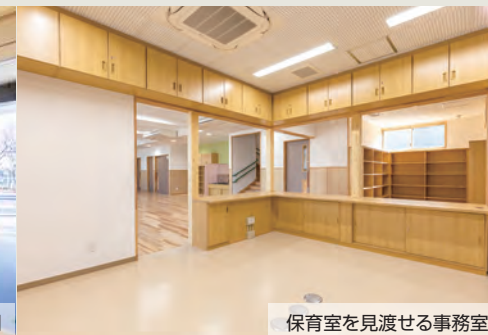
保育室を見渡せる事務室