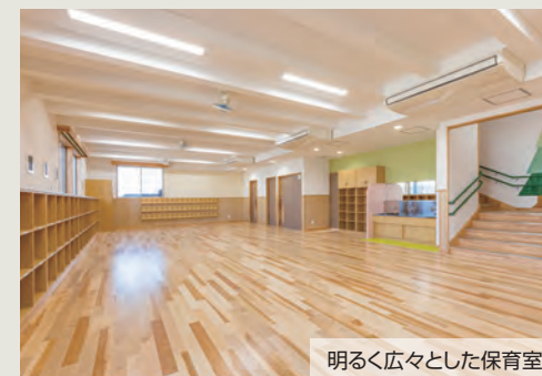
明るく広々とした保育室

また、LED照明、人感センサーによる照明制御方式の採用、ヒートポンプ式パッケージエアコンの採用をすることにより、環境に配慮した設備計画としました。施設2階の床には、遮音マットを採用することにより1階へ伝わる音を軽減できるよう配慮いたしました。