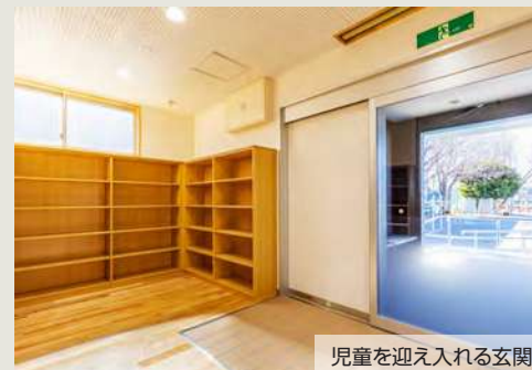
児童を迎え入れる玄関