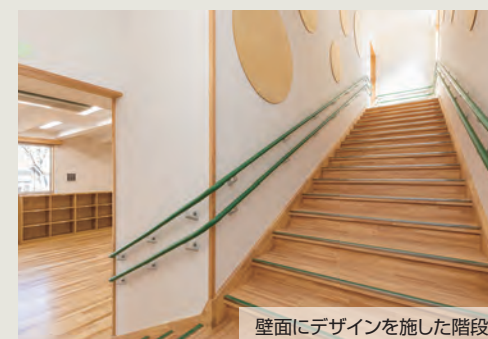
壁面にデザインを施した階段