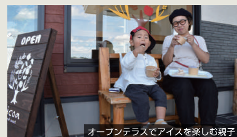
オープンテラスでアイスを楽しむ親子

※「Ricoa」の名称は、ライス、コーヒー、リンゴと原材料の英語の頭文字を取り命名。「Rico」は「豊かさ・美しい」、「a」には「一つ」という意味があり、障がい者ひとりひとりが豊かな人生を送れるよう願いが込められています。