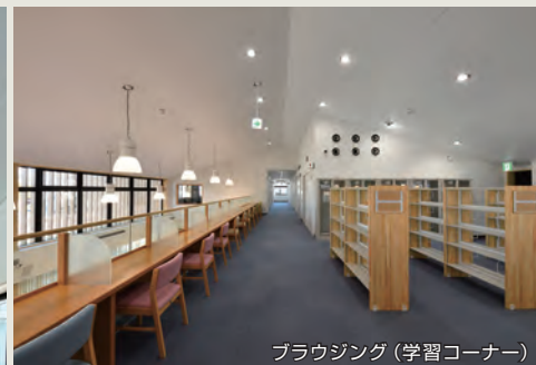
ブラウジング（学習コーナー）