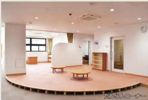
だんらんコーナー