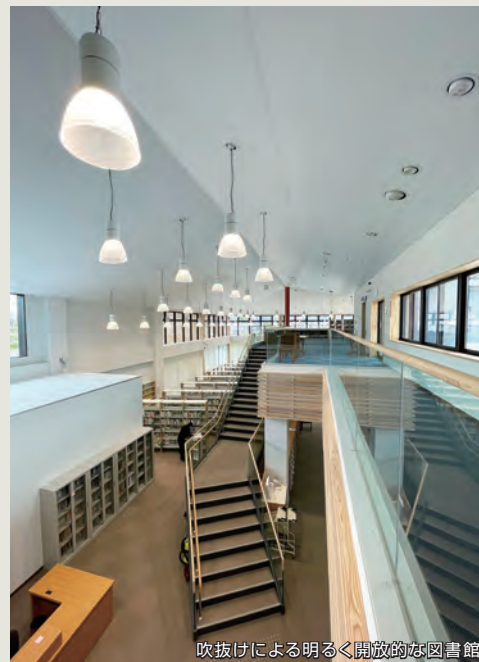
吹抜けによる明るく開放的な図書館

永らく地域コミュニティを支えてきた公民館・図書館の老朽化に伴いDBO方式（設計・施工・運営）を導入する建替事業がこの度、執り行われました。図書館、公民館、多目的ホール、子育て支援の機能を有する社会教育施設として、地域住民の皆様とワークショップにも取り組み、住民の皆様の意見を反映した施設となりました。平泉町の交流や情報発信の基盤施設として2022年7月にオープンいたします。