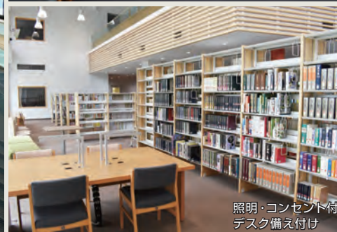
照明・コンセント付 デスク備え付け