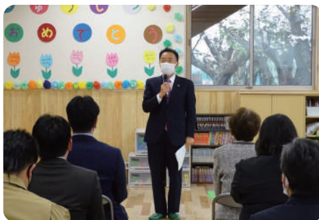
並木市長によるご挨拶