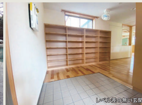
レベル差の無い玄関