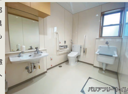
バリアフリートイレ