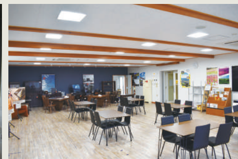
休憩・展示コーナー