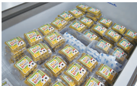
全国有数の鶏肉名産地 66の飼育農家が誇る美味しいチキン!