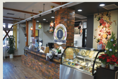
人気のジェラート店