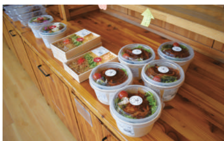
売り切れ続出!人気の各種お弁当