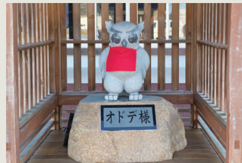
道の駅を見守る怪鳥オドデ様