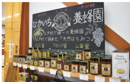
九戸村産100%の天然はちみつ