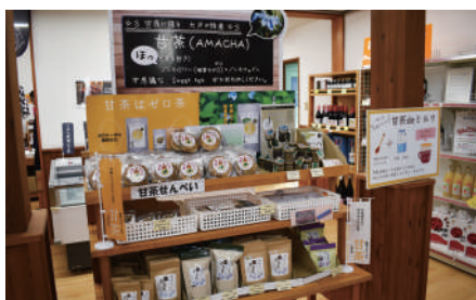
ゼロカロリー・ノンシュガー 健康あま茶