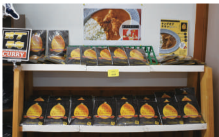
「キングオブチキン」特産カレー