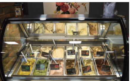
季節の味がそろうジェラート