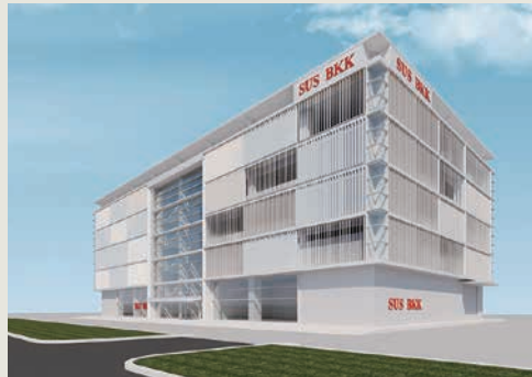
ナショナルエンジニア作成のSUSBKK新本社工場パース