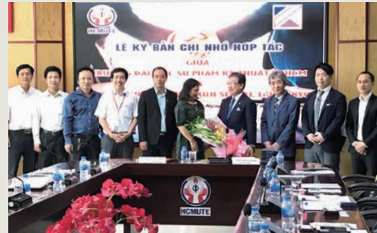
ベトナム国ホーチミン師範大学(HCMUTE)にて調印式

久慈設計グループは海外への技術支援に積極的に取り組んでおります。2019年11月、ベトナム国ホーチミン師範大学(HCMUTE)において、弊社設計スタッフが大学講師として業務契約を行い、ベトナム国の設計を志す若い世代と交流がスタートしています。BIM(3次元設計)講義やデジタル建築デザイン教育を通じ、国際貢献としてコロナパンデミックにも負けず交流は続いています。