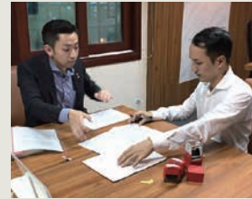
ベトナム技術協会会社VIHOUSEと 契約締結の様子