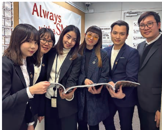
久慈設計グループに在籍するナショナルエンジニアの皆さん

久慈設計グループには現在9名のナショナルエンジニアが在籍しております。タイ王国、ベトナム、フィリピン共和国から日本の建築文化を学び、世界で活躍することを夢に若者たちが集い久慈設計グループの一員として、日々の業務に邁進しております。近年はアジア圏での海外事業の需要拡大に伴い、今後一層、国際業務を中心としたナショナルエンジニアの活躍が期待されます。