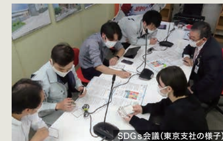
SDGs会議(東京支社の様子)

SDGsとは、2015年9月の国連サミットで採択された、より良い世界を目指す「持続可能な開発(Sustainable Development Goals)」のことです。社会が抱える問題解決の取り組みとして久慈設計グループの活動は継続していきます。