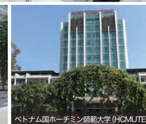
ベトナム国ホーチミン師範大学(HCMUTE)