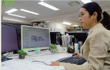
現在、東京支社建築設計部に所属(業務中の様子)