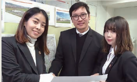
タイ王国チームメンバー

2019年11月8日、タイ王国首都バンコク市内にて現地法人「KUJI SEKKEI THAI CO.,LTD.」を設立後、タイ国出身エンジニアが久慈設計グループに集まりました。自国では建築意匠設計・構造設計(実施設計)やランドスケープ(景観デザイン)など、各専門分野を得意とする有資格エンジニアたちが、タイ王国現地と日本国久慈設計グループの技術の繋ぎ手として、今後海外事業の場で活躍して参ります。