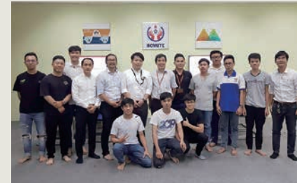
現地大学の皆さんと弊社設計スタッフ