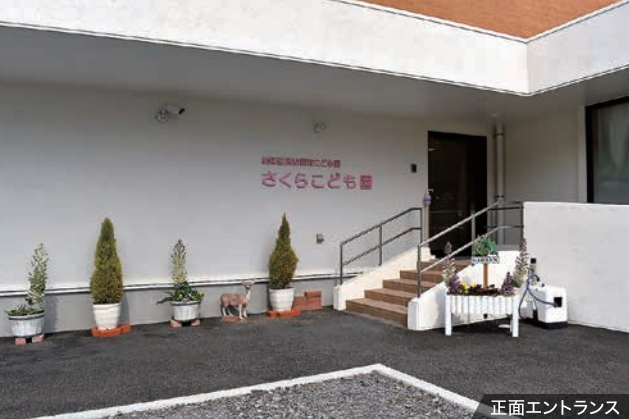
正面エントランス