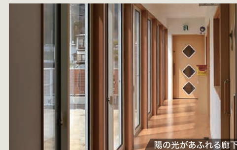
陽の光があふれる廊下