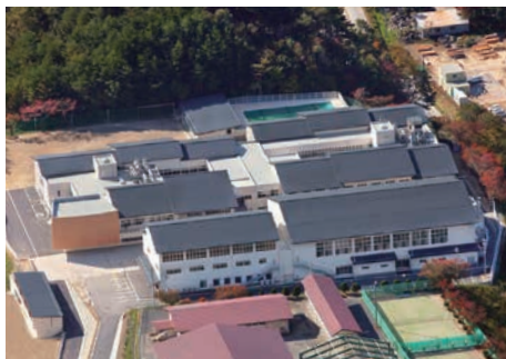
小中一貫校 大槌学園 (プロボ-ザル当選)

皆様と共に歩ませていただいた12年間。大槌町での作品を一部ご紹介させていただきます。