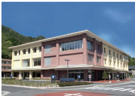
岩手県立大槌病院 (プロボ-ザル当選)