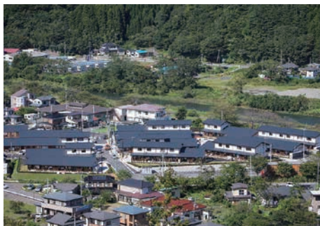
大槌町営大ヶロー地丁目住宅 (プロボ-ザル当選)