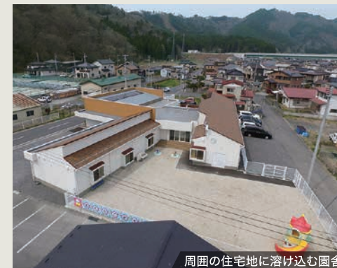
周囲の住宅地に溶け込む園舎

3歳児以上が元気に走り回れる「いきいき園庭」と3歳児未満が安心して遊べる「静かな園庭」の性格の異なる2つの園庭を設け、学齢に応じた遊びの環境を整備しました。施設内部には、アルコーブや読書ベンチなどの小さなまりの空間や窓の高さをランダムに変え、子どもたちの好奇心をくすぐる設えとしております。また事務室を中心に、各諸室を放射状に配置し、保育士の目が行き届きやすい、自然の光も各部屋にまんべんなく降り注ぐ、暖かで明るい環境を実現いたしました。施設性能としても、0歳児保育室に床暖房を採用し、居室環境に配慮する計画としました。また太陽光パネルからの電力活用に蓄電池を設置し、省エネルギー化にも取り組みをさせていただきました。